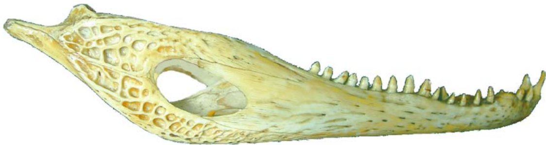
Figura 6. Cráneo de Caimán. Mandíbula, vista lateral.