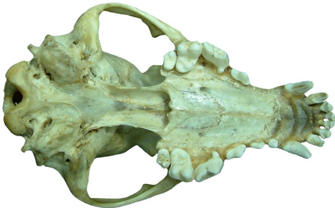
Figura 22. Cráneo de perro, vista ventral.