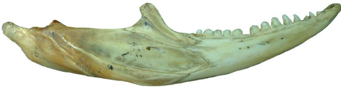
Figura 9. Cráneo de Saurio. Mandíbula inferior, vista lateral.