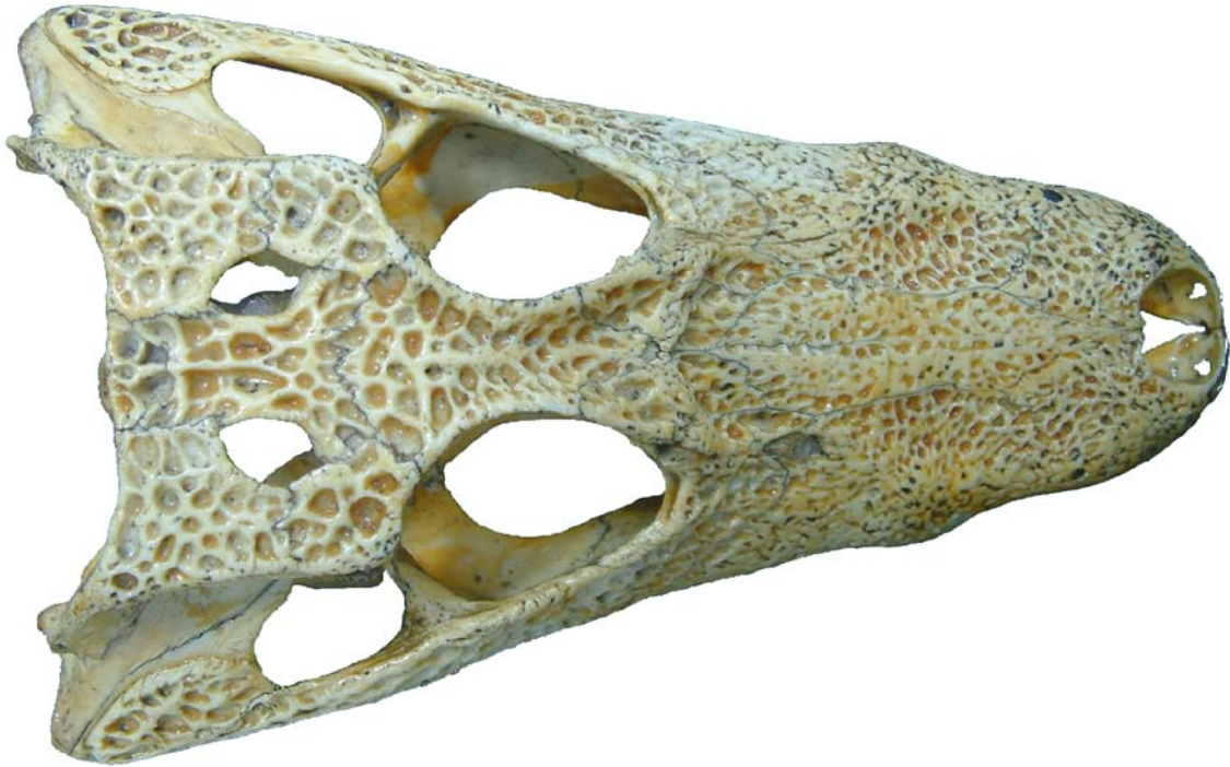
Figura 3. Cráneo de Caimán, vista dorsal.