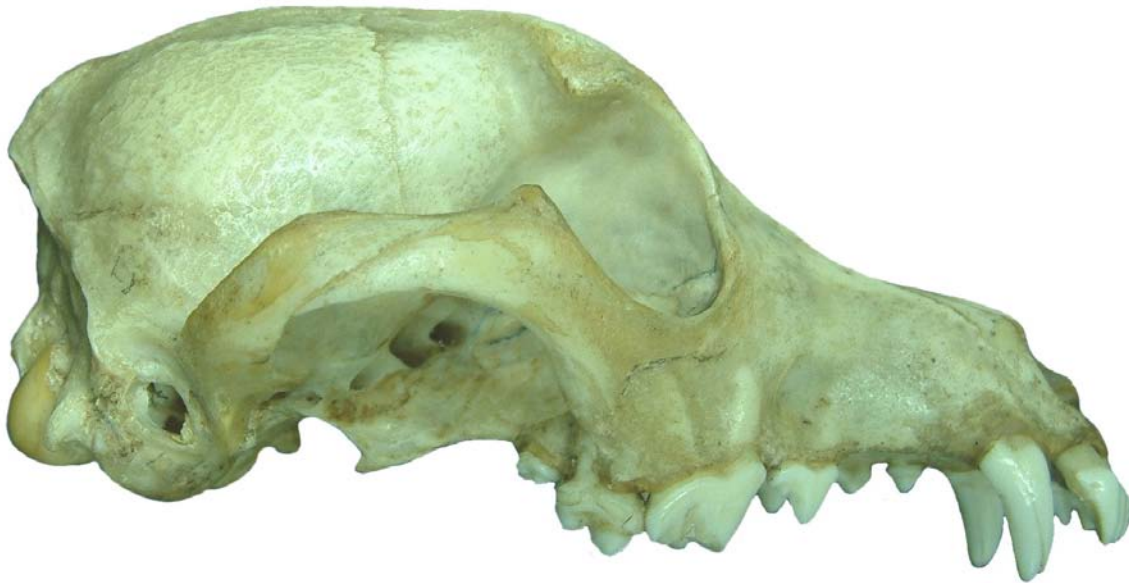
Figura 23. Cráneo de perro, vista lateral.