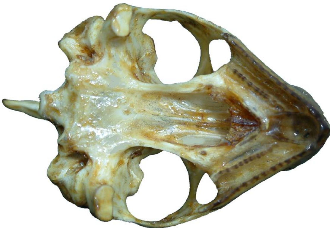
Figura 14. Cráneo de tortuga, vista ventral.