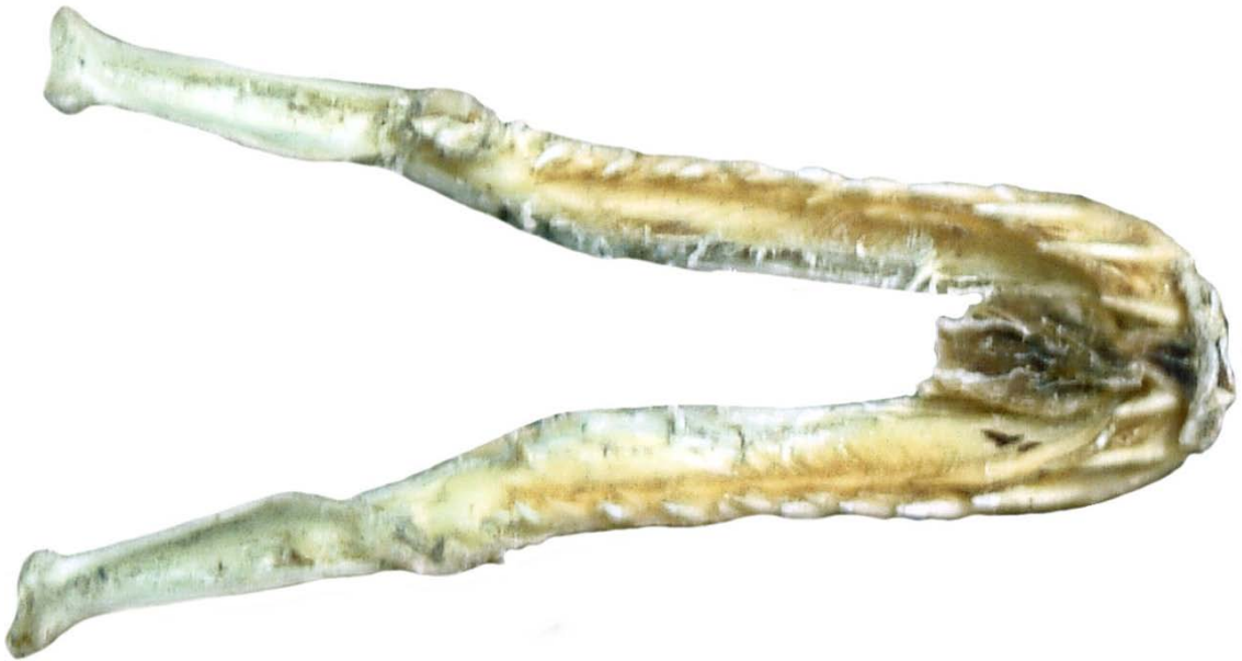
Figura 12. Cráneo de Ofidio. Mandíbula inferior, vista dorsal.