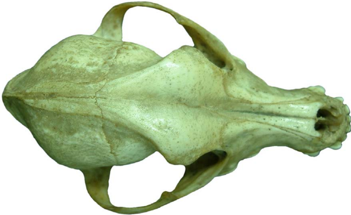
Figura 21. Cráneo de perro, vista dorsal.