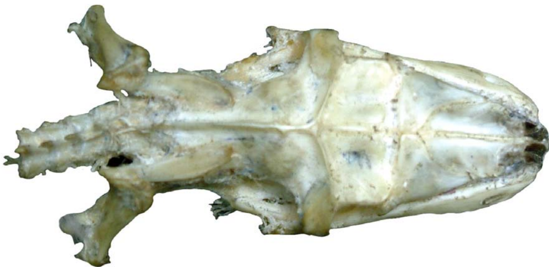
Figura 10. Cráneo de Ofidio, vista dorsal.