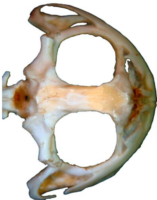
Figura 1. Cráneo de Anuro, vista dorsal.