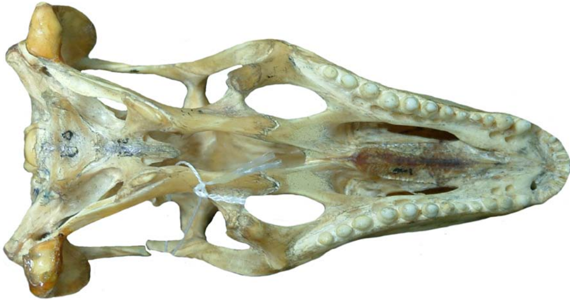
Figura 8. Cráneo de Saurio, vista ventral.