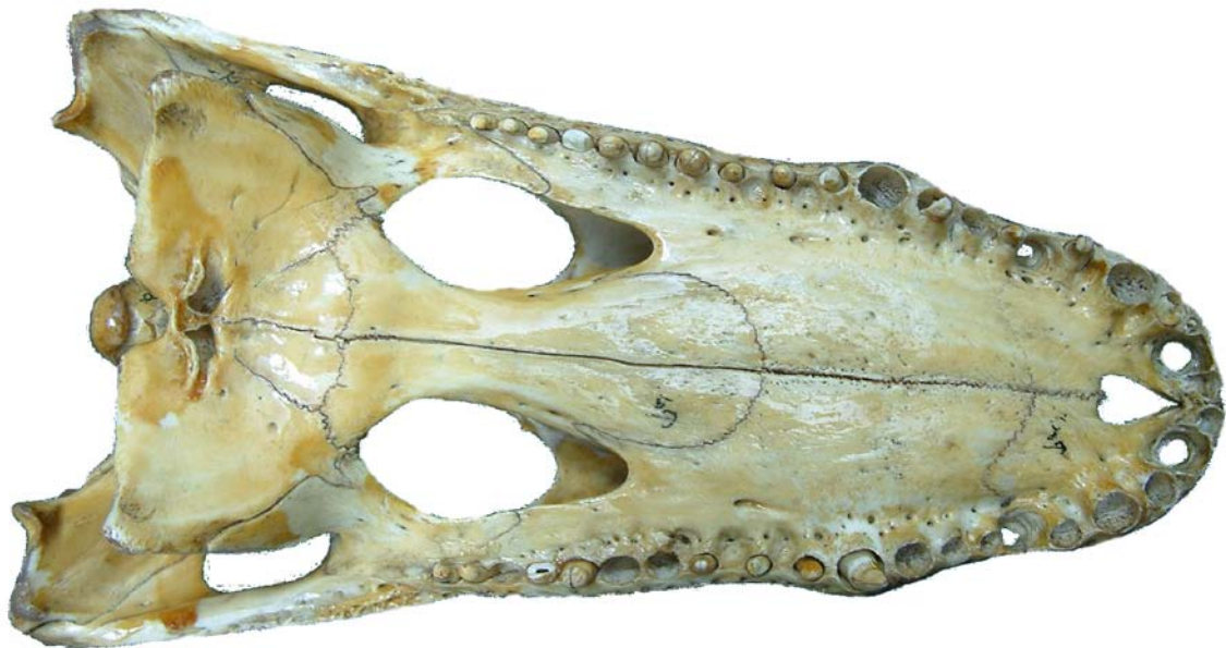
Figura 4. Cráneo de Caimán, vista ventral.