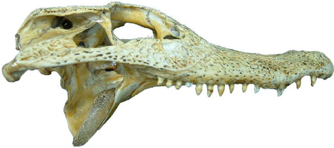
Figura 5. Cráneo de Caimán, vista lateral.