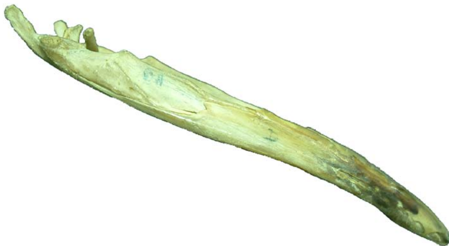
Figura 19. Cráneo de ave. Mandíbula, vista lateral.