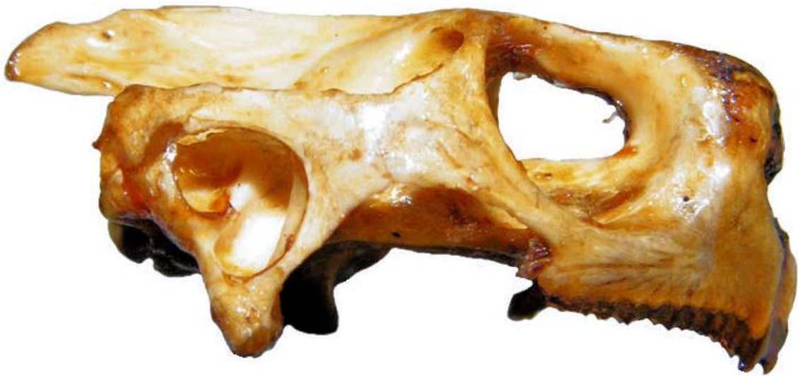
Figura 15. Cráneo de tortuga, vista lateral.