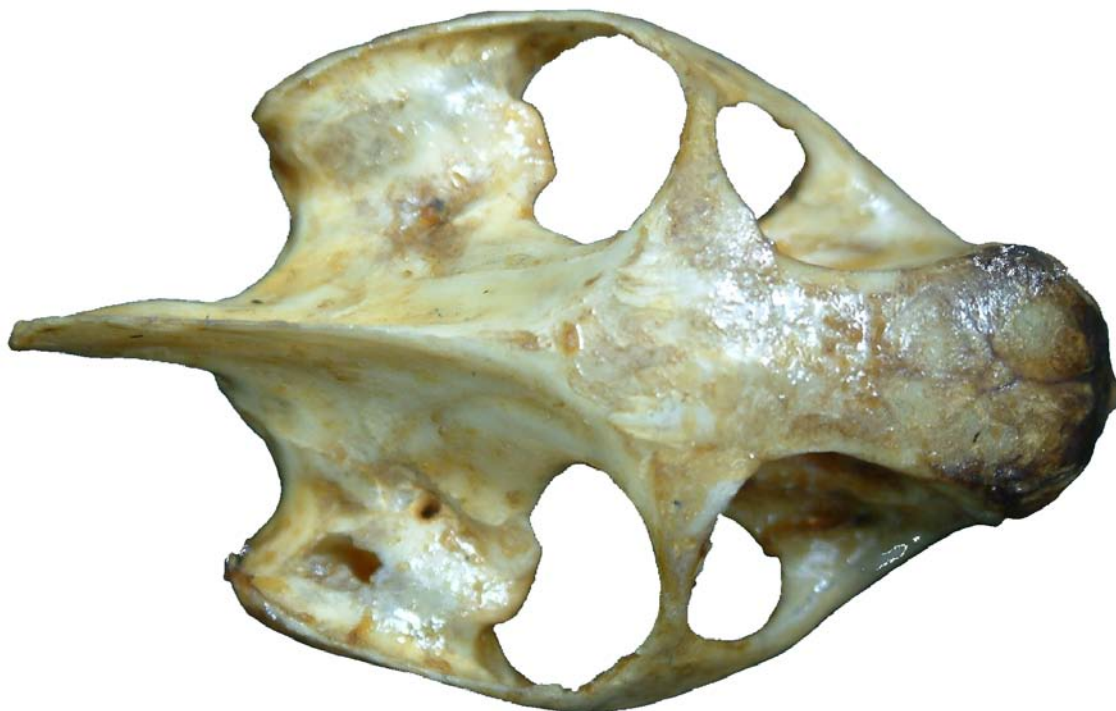
Figura 13. Cráneo de tortuga, vista dorsal.