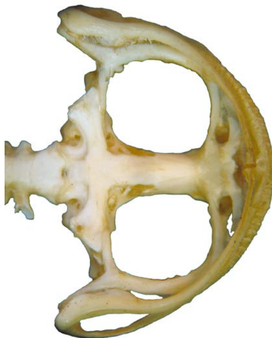
Figura 2. Cráneo de Anuro, vista ventral.