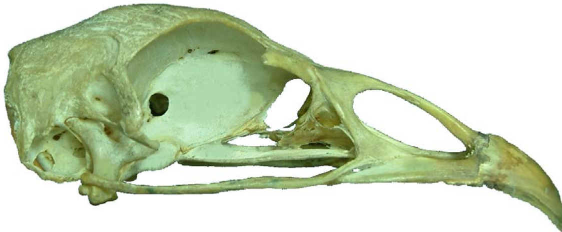
Figura 18. Cráneo de ave, vista lateral.