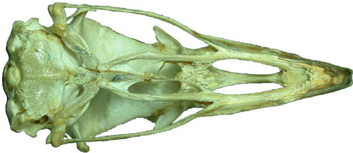
Figura 17. Cráneo de ave, vista ventral.