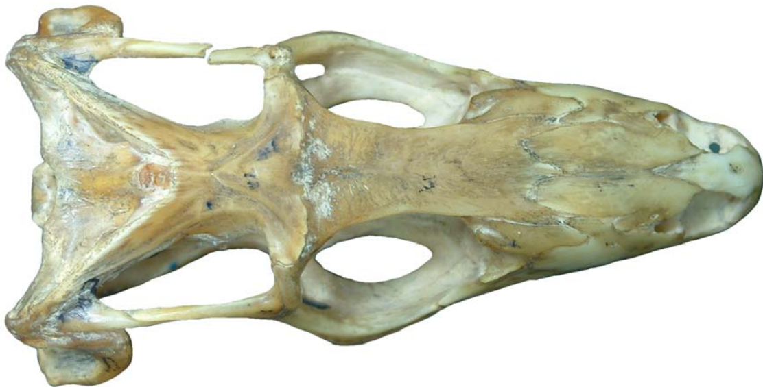
Figura 7. Cráneo de Saurio, vista dorsal.