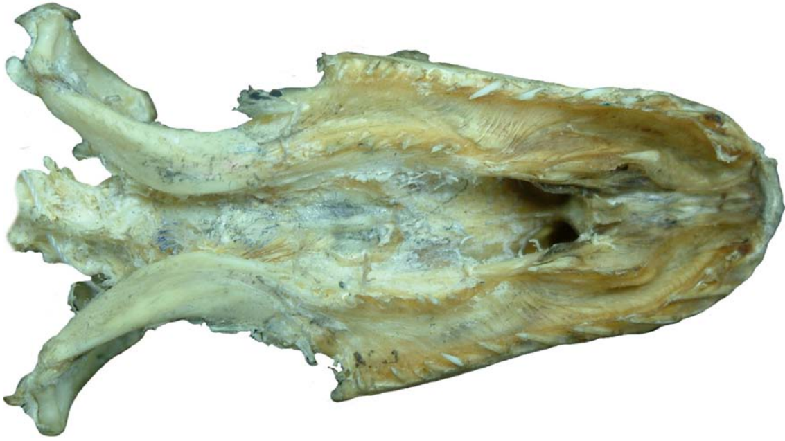
Figura 11. Cráneo de Ofidio, vista ventral.