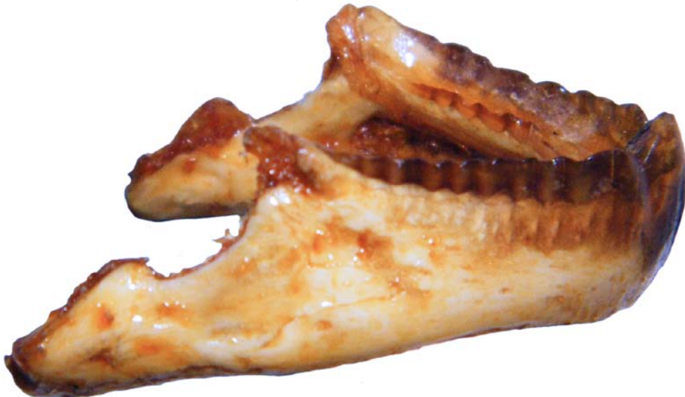
Figura 16. Cráneo de tortuga. Mandíbula inferior, vista lateral.