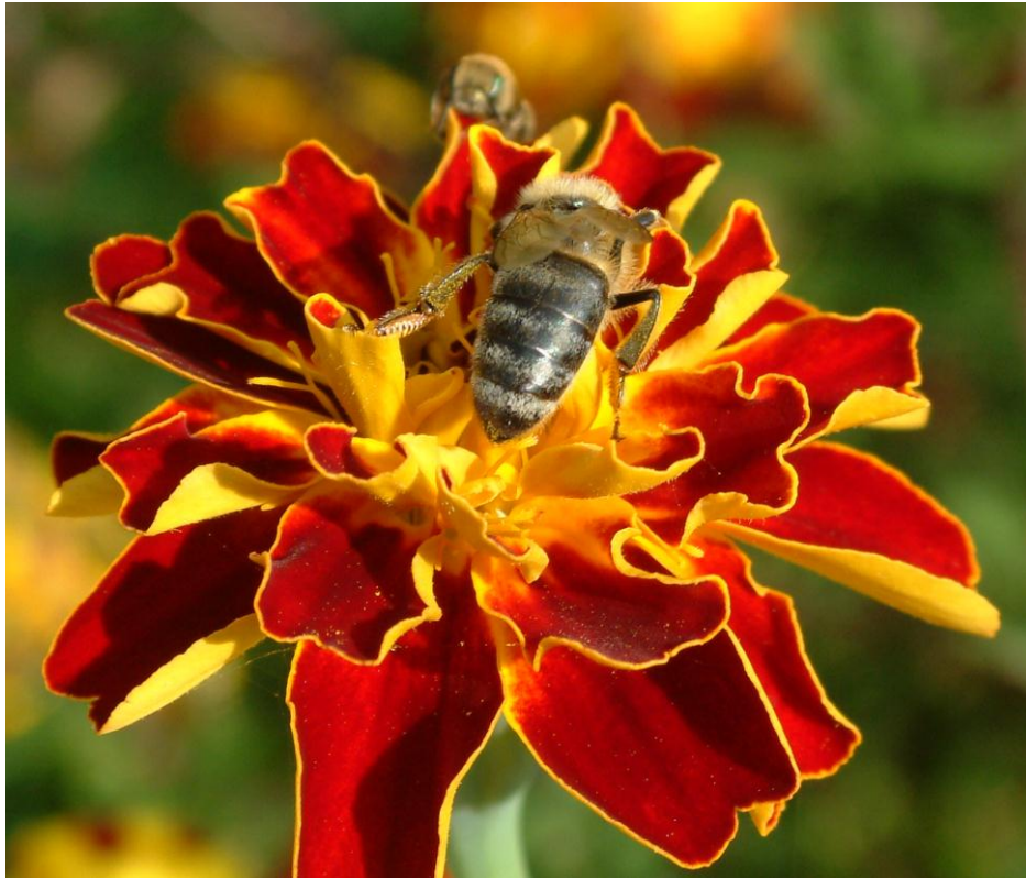
Figura 6. Ejemplares de abejas recogiendo polen de una flor.

Y a las abejas en general, a las silvestres, básicamente les sucede lo mismo: no están sufriendo el síndrome del colapso de colonias, pero también sus poblaciones se están viendo muy afectadas, con una gran regresión por la acción antrópica, los biocidas, la pérdida de hábitat y el cambio climático. Por ejemplo, están desapareciendo las especies de abejorros, del género Bombus , muchas de ellas amenazadas, incluso en España, pero también especies de otras familias, como Colletidae, Melittidae, Megachilidae, Anthophoridae y seguramente del resto. Es decir, se resiente su papel esencial en la naturaleza, como polinizadores, el que realizan las abejas, todas las especies de abejas y la enorme importancia que tiene su servicio ecológico y el valor económico de este.