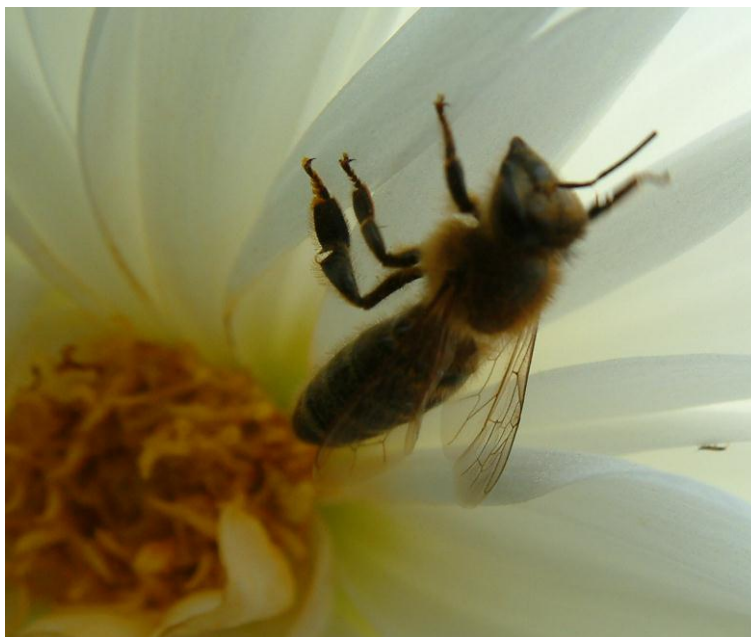
Figura 3. Fotografía de una abeja de la miel ( Apis mellifera ).