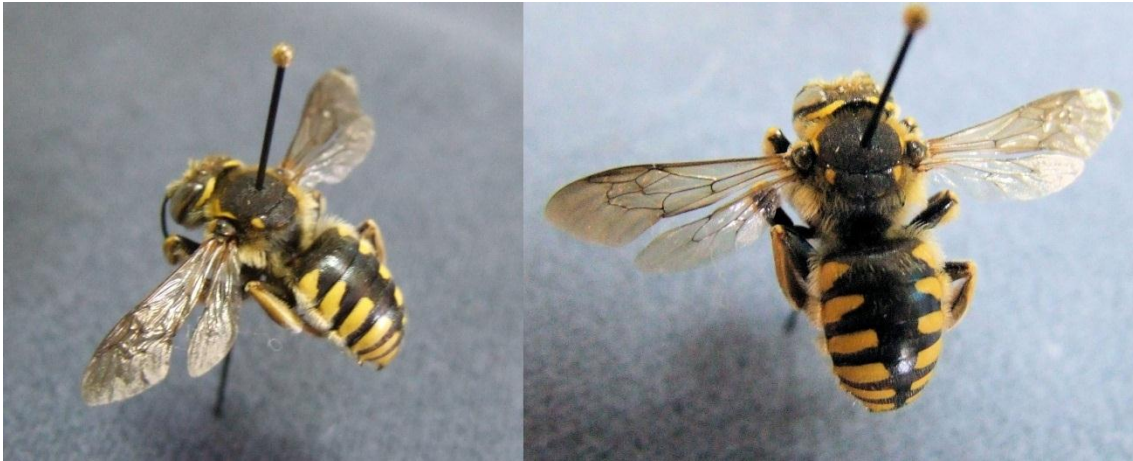
Figura 5. Fotografías de una abeja, Anthidium florentinum (Fabricius, 1775), de la familia Megachilidae.

En términos económicos, su valor es incalculable. Se ha estimado que, en EEUU, un tercio aproximadamente de sus recursos alimentarios dependen directa o indirectamente de la polinización por insectos, principalmente abejas, tanto sociales como solitarias (BATRA, 1984). Alrededor del 84% de las especies cultivadas en Europa también depende de tal polinización, al igual que ocurre con el 70% de los principales cultivos destinados al consumo humano a nivel mundial. Producen altos rendimientos al maximizar la fortaleza y resistencia de las plantas y permitir la reducción del uso de biocidas y otros costes ambientales. En cifras, el servicio para el uso humano que prestan asciende a 153.000 millones de euros al año, equivalente a casi la décima parte del total de la producción mundial de alimentos agrícolas (PROYECTO ALARM). Asimismo, la FAO considera que de las poco más de 100 especies de cultivos que proporcionan el 90 % del suministro de alimentos para 146 países, 71 son polinizadas por abejas (casi toda silvestres). Pero subraya que podría estimarse que el valor monetario anual de los servicios de polinización en la agricultura mundial podría ascender hasta a 200.000 millones de dólares.