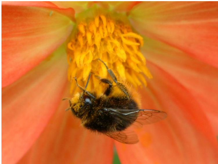
Figura 2. Fotografía de un abejorro ( Bombus lapidarius ).

Existen abejas sociales y solitarias y muy distintos niveles evolutivos de sociabilidad y complejidad (ORNOSA y ORTIZ-SÁNCHEZ, 2004; ORNOSA, 2009). Entre los grupos sociales más evolucionados, se encuentran los componentes de la familia Apidae: los abejorros (especies del género Bombus Latreille, 1802) (Fig. 2) y la conocida abeja de la miel ( Apis mellifera , Linnaeus, 1758) (Fig. 3). Las abejas solitarias, sin embargo, son mucho más abundantes. Sobrepasan el 85 % de las 20.000 especies de abejas que existen en el mundo y se reparten en 6 familias con representantes en nuestra fauna (Colletidae, Halictidae, Andrenidae, Melittidae, Megachilidae y Anthophoridae), más 2 de distribución tropical (ORNOSA y ORTIZ-SÁNCHEZ, 2004; MICHENER, 2007).