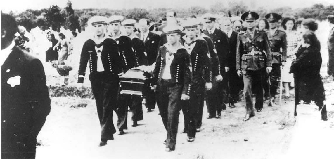
Figura 2. Funeral del Capitán Langsdorff en Argentina, 1939 (US Naval Historical Center).

Photo # NH 85636 Funeral procession of Capt. Hans Langsdorff of the Admiral Graf Spee, December 1939