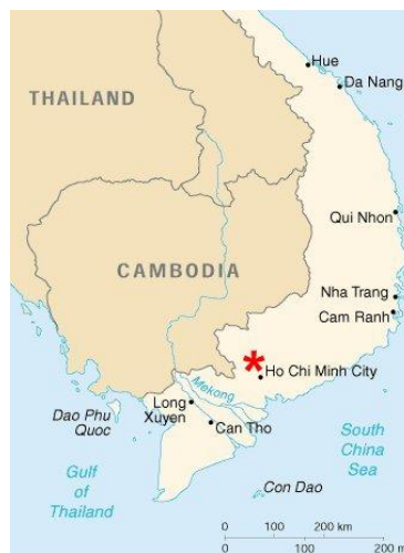
Figura 1. Mapa de Camboya y sus Estados vecinos.

Una pregunta de Relaciones Internacionales: A los efectos de contextualizar adecuadamente la historia que se narra, exponga un breve resumen de la situación de origen (1973) que se daba en ese Estado y en la región, prestando también atención a la presencia/actuación de los Estados Unidos de América que igualmente aparece en la película.