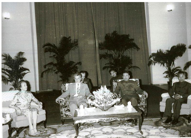
Figura 2. Nicolau Ceaucescu y Pol Pot, 1978 (Archivo Nacional Rumano).