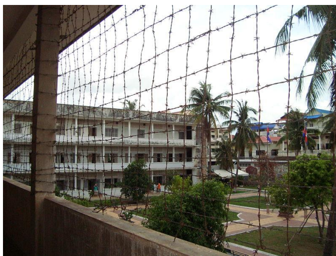
Figura 4. Museo del Genocidio de Phnom Penh (Adam Jones, 2009).