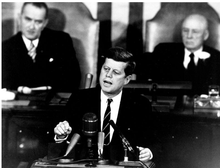
Figura 3. Discurso del Presidente J.F. Kennedy en el Congreso (NASA).

Relaciones Internacionales: Además de suponer una amenaza a la seguridad de los Estados Unidos, este país considera que el despliegue soviético perjudicaría la hegemonía de Washington sobre el hemisferio americano ¿Qué doctrina intervencionista sustenta el embargo económico a Cuba, vigente desde entonces? ¿Por qué recurren a la Organización de Estados Americanos para que respalde esta medida?