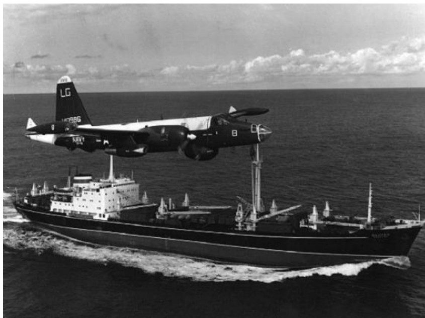
Figura 2. P-2H Neptuno sobrevolando un buque ruso en octubre de 1962 (USN, Dictionary of American Naval Aviation Squadrons Vol. 2).