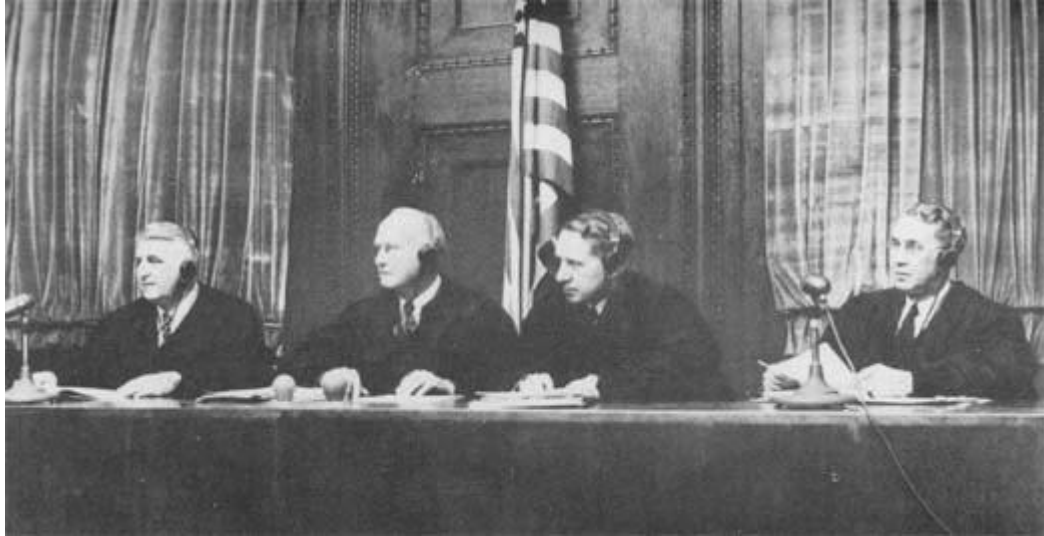
Figura 5. Jueces del Tribunal de Nuremberg.