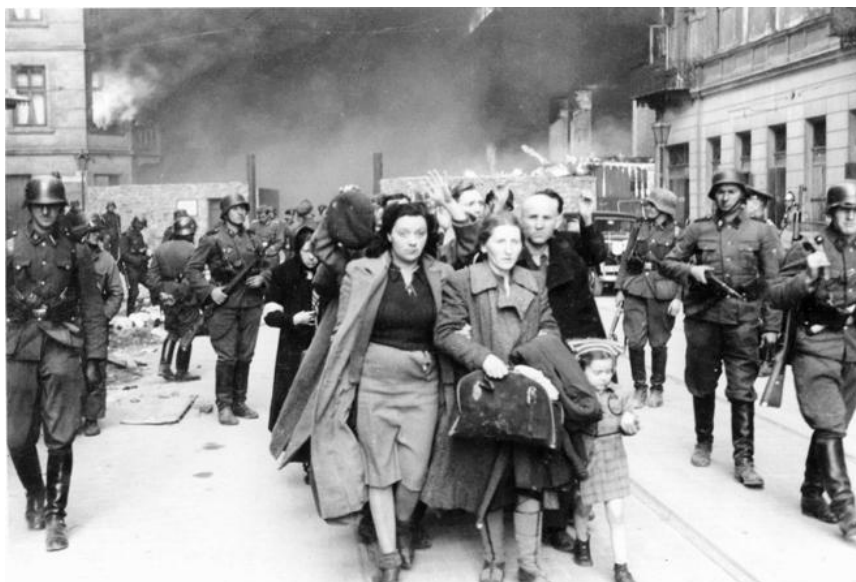
Figura 4. Gueto de Varsovia, 1943.

Si el escenario que se plantea es pues de completa oposición entre disposiciones de Derecho interno y disposiciones del Derecho internacional, ¿cómo habría que resolver ese “problema”? Justifique su respuesta.