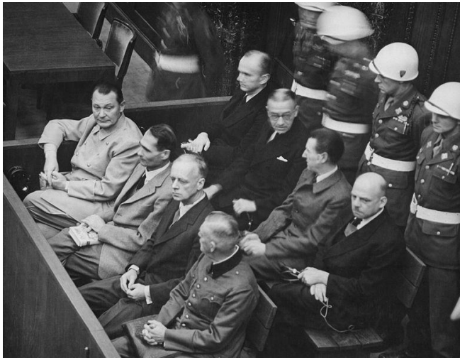
Figura 1. Juicio de Nuremberg, 1946.

formar parte de uno de los tribunales que una vez concluida la Segunda Guerra Mundial, se establecieron para enjuiciar algunos de los crímenes que se cometieron durante el Tercer Reich alemán. En concreto, esta película recrea lo que conoció como el “Juicio de los jueces”, en el que se enjuiciaron a varios representantes del aparato de Justicia de la Alemania nazi por sus responsabilidades como “legalizadores” de los crímenes del nazismo; es decir, como afirmara el fiscal en estas causas, por su responsabilidad en los “crímenes cometidos en nombre de la ley”.