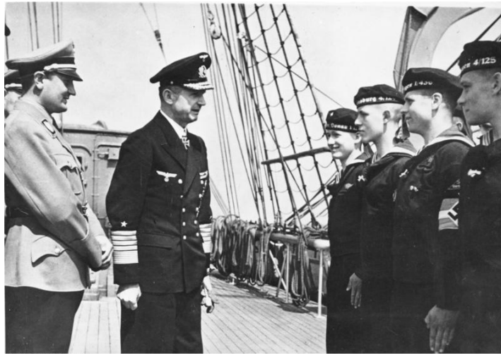
Bundesarchiv, Bild 153-J16093 Foto: Ende | November 1943