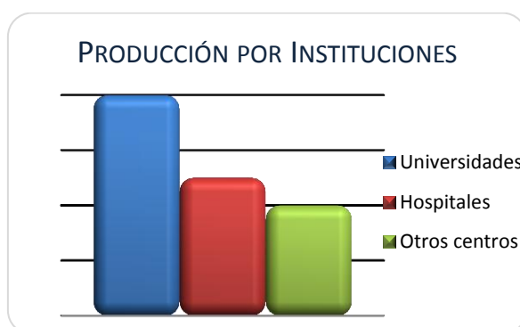
Gráfico 2. Distribución de Instituciones.

En el Gráfico 2 se muestra la distribución de instituciones firmantes. Puede observarse que la mayor producción procede de Universidades, seguida de la producción por parte de Hospitales.