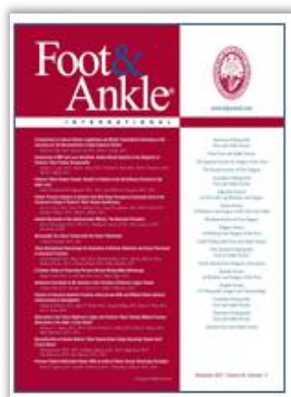
Figura 1. Portada revista “Foot and Ankle International”.

La revista elegida para iniciar este estudio ha sido la revista “Foot and Ankle International” (Fig. 1) dado que es la publicación que presenta una periodicidad más frecuente, su factor de impacto es el mayor entre las comentadas y está contenida en la base de datos Science Citation Index (SCI), lo que nos permitirá realizar el análisis de citas.